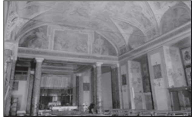
Il-Kappella ddedikata lil San Lawrenz fis-Sancta Sanctorum

Tagħrif miġbur mit-III Edizzjoni 1988 La Scala Sancta