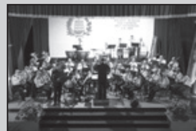
Il-Banda Vittoriosana San Lawrenz waqt il-Programm Annwali Is-Sibt 28 t'Ottubru, 2017