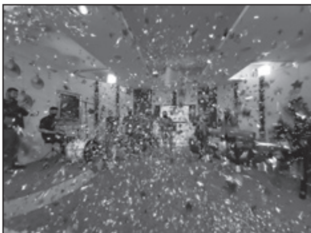
It-tmiem tal-Maratona li saret minn V-SL Media nhar il-Hadd 20 ta' Dicembru, 2020