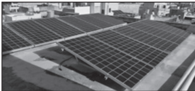
Jitwaħħlu l-pannelli fuq wieħed mill-bjut ta' Palazzo Huesca