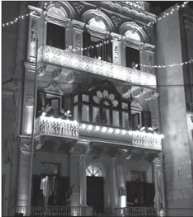
24 ta' Dicembru, 2020 - Bandisti tal-Banda Vittoriosana San Lawrenz idoqqu Christmas Carols mill-galleriji ta' Palazzo Huesca