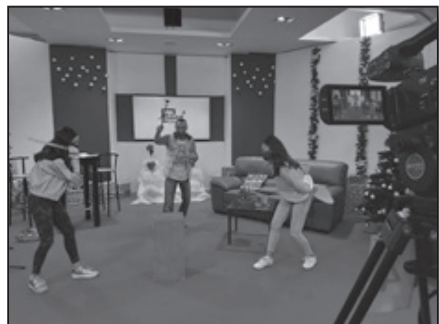
Mument minn wieħed mill-programmi mtella' minn V-SL Media